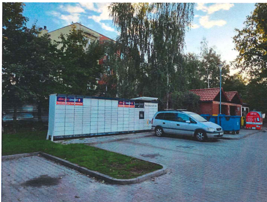
Fot. 2. Lokalizacja przy ul. Zielnej