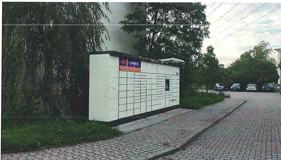
Fot. 5. Lokalizacja przy ul. Kamieńskiego

Przesz Zarządu Monika Tendaj - Bielawska Monika Tendaj - Bielawska