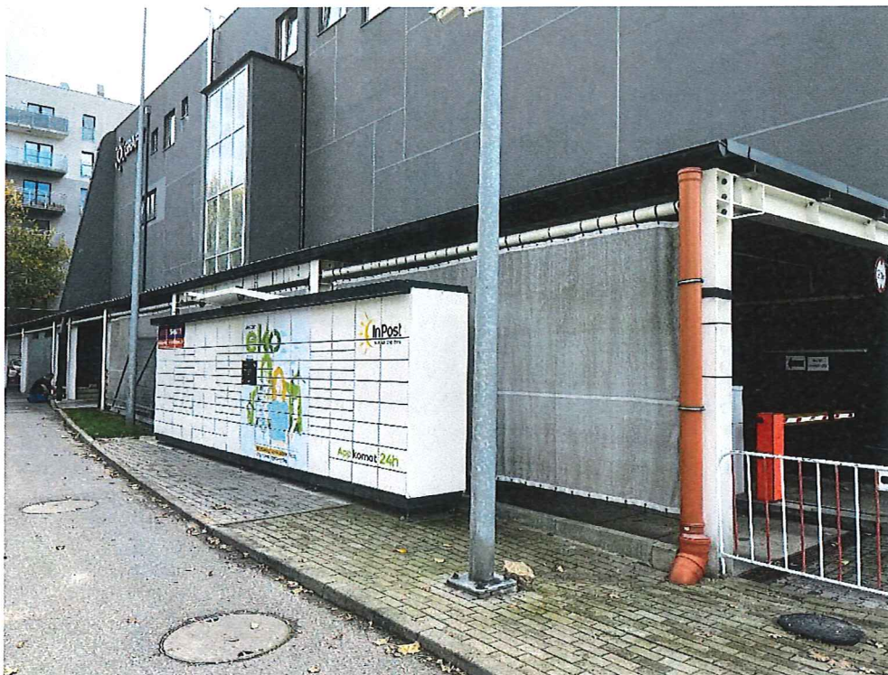
Fot. 3. Lokalizacja przy ul. Namysłowskiej