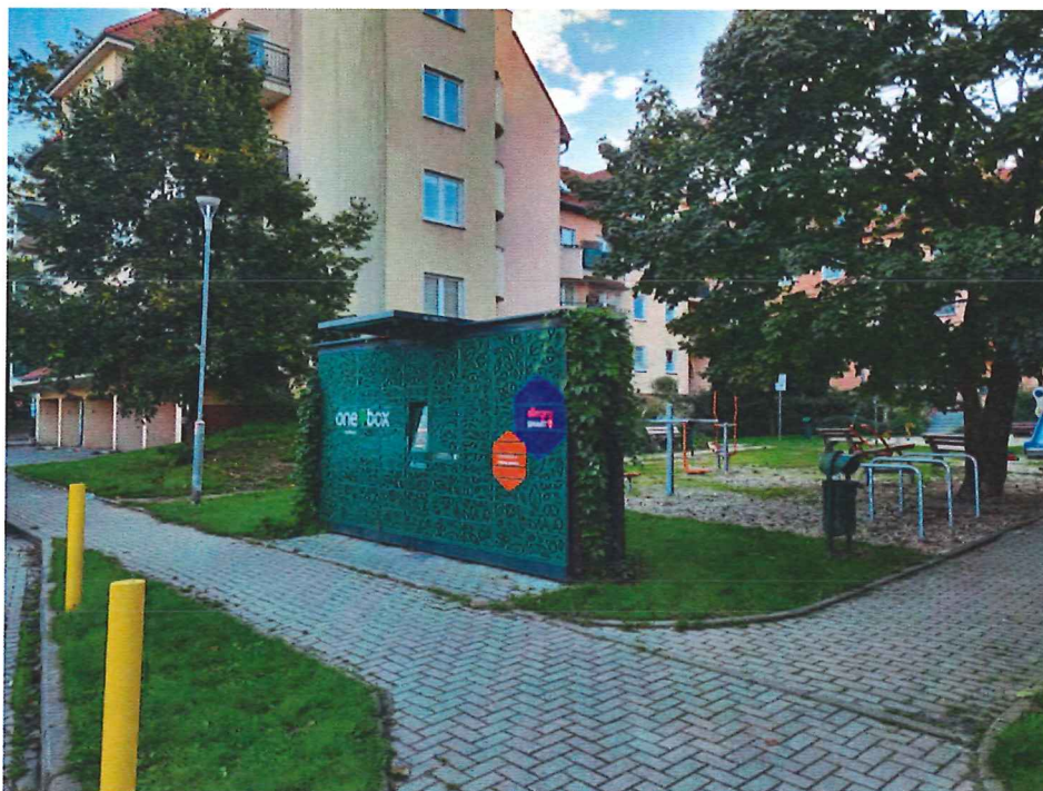
Fot. 1. Lokalizacja przy ul. Bolesława Krzywoustego 285