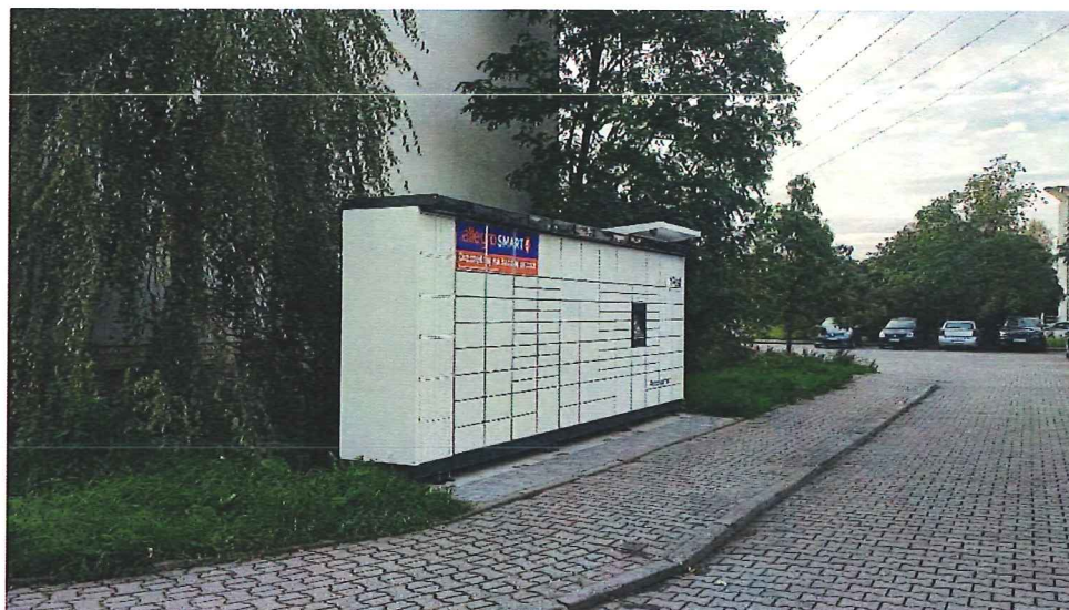
Fot. 5. Lokalizacja przy ul. Kamieńskiego