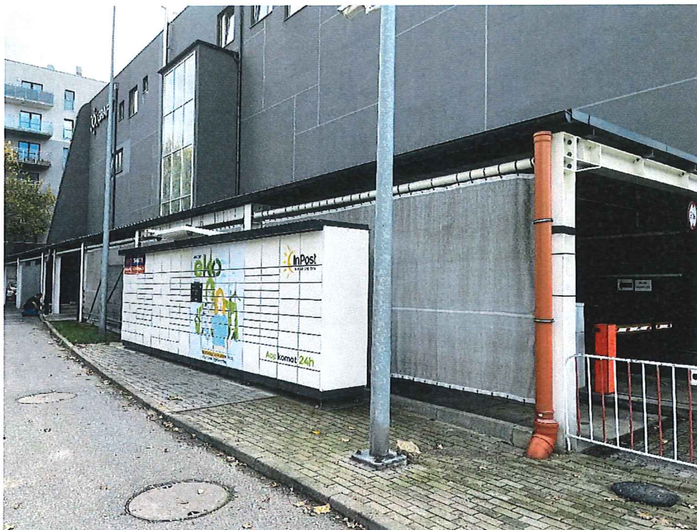
Fot. 3. Lokalizacja przy ul. Namysłowskiej